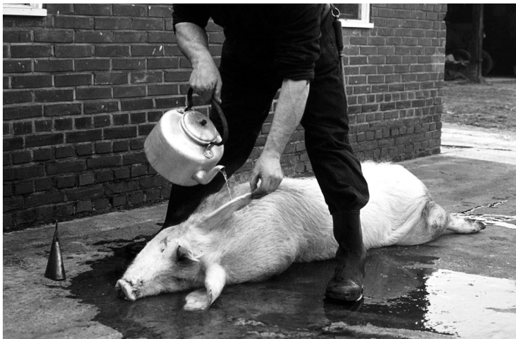
Het varken werd met heet water "gebroid".

Het te slachten varken moest de dag van te voren vasten. Door de slachter werd het dier met een schietmasker bewusteloos gemaakt. Daarna werd er een snee in de halsslagader toegebracht, terwijl het bloed in een emmer of teil met wat koud water werd opgevangen onder voortdurend kloppen. Het werd ook later nog enige tijd geklopt om stolling te voorkomen. Voordat er "bloodkooke" van werd gemaakt moest het bloed eerst gezeefd worden.