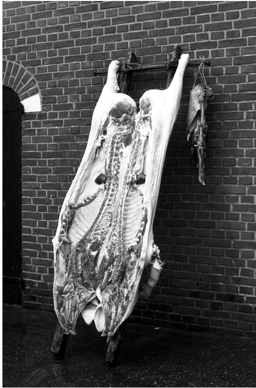
Het geslachte varken werd buiten op de ladder gehangen om af te koelen.

Tegenwoordig halen we onze vleeswaren bij de supermarkt en lezen op de verpakking dat het vlees van een varken is. De hedendaagse consument heeft zelden een varken in levende lijve gezien, laat