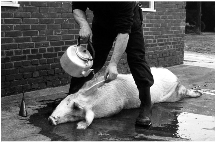
Het varken werd met heet water "gebroid".

Het te slachten varken moest de dag van te voren vasten. Door de slachter werd het dier met een schietmasker bewusteloos gemaakt. Daarna werd er een snee in de halsslagader toegebracht, terwijl het bloed in een emmer of teil met wat koud water werd opgevangen onder voortdurend kloppen. Het werd ook later nog enige tijd geklopt om stolling te voorkomen. Voordat er "bloodkooke" van werd gemaakt moest het bloed eerst gezeefd worden.