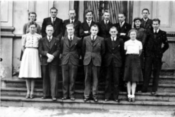
Alle leden van het distribuebureau

Al de volgende morgen "waren de 'Grünen' uit Enschede er al. Ze donderden door het dorp en verhoorden alle ambtenaren op het gemeentehuis. Bij Hakkert deden ze ook huiszoeking. Ze vonden enkele illegale blaadjes en gestencilde nieuwsberichten van de Engelse zender; ze hebben hem meegenomen en overgebracht naar Amersfoort."