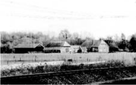
Boerderij “De Meijer”

De gevolgen voor de buurtbewoners waren echter groot. De volgende dag werd de hele omgeving afgezet en zij werden