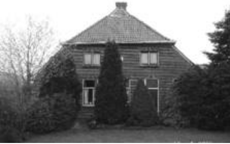
Boerderij “De Hunger”

Reeds in 1947 kon bij “De Hunger” de nieuw gebouwde boerderij, die voor de regeling van de oorlogsschade in aanmerking kwam, in gebruik worden genomen. Omdat bij “De Meijer” alleen het woonhuis en de koestal waren afgebrand en de schöppe (schuur) was blijven staan kon een deel van het vee gestald worden en werd de rest verkocht. Zelf vonden ze eerst onderdak bij Greven (Get Nieland). Daarna werd het kippenhok ingericht waarin ze tot 1952 hebben gewoond. Dit wonen was echter zeer gebrekkig en de veehouderij kon door gebrek aan stalruimte slechts in beperkte mate worden voortgezet. Als gevolg van ambtelijke regelgeving kwamen ze voor geen enkele herbouwing in aanmerking. Dokter Wanrooij en de Stichting 1940-1945 hebben ervoor gezorgd dat er uiteindelijk weer gebouwd kon worden.