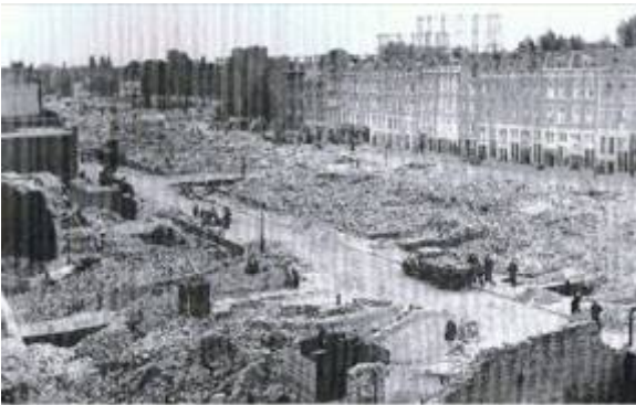
Ergens in deze puinhopen stond ons huis

Dit bombardement werd de aanleiding tot de capitulatie van Nederland en de bezetting door de Duitsers.