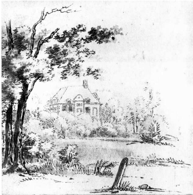
de Stoevelaar, geteekend door J. van der Wijck

Negenenzeventig jaar oud overleed Jacob van Coeverden in 1707 op de Stoevelaar. Jacob was