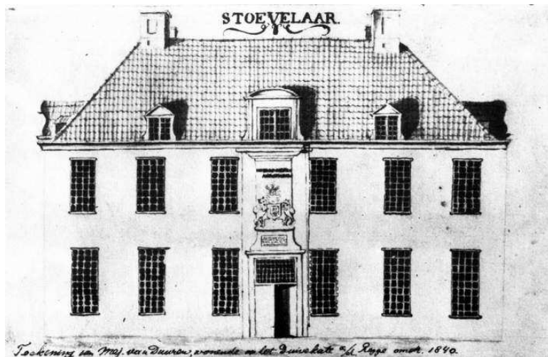
Het Herenhuis dat ter vervanging van de Havezate Stoevelaar werd gebouwd. Tekening van 1840.