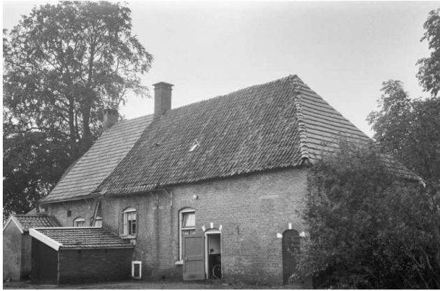
achterzijde bouwhuis bij Stoevelaar